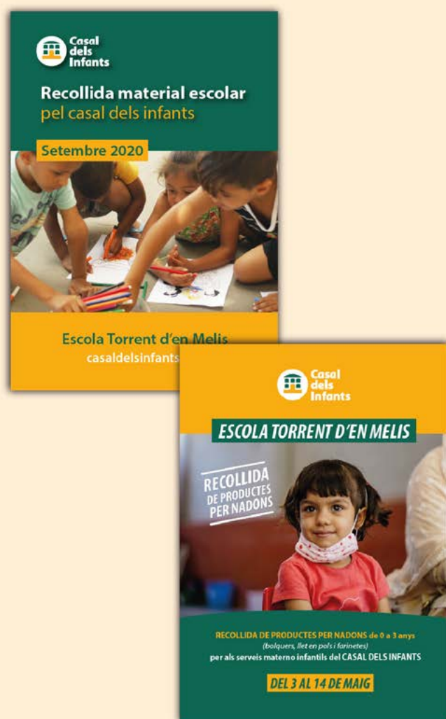
Carteles de las campañas de recogida de la escuela Torrent d'en Melis.

Sí, en septiembre, hacemos campaña de recogida de material escolar y antes de diciembre me gustaría hacer una charla de sensibilización para los niños de 5.º y 6.º con la actividad "Podrías ser tú" para que escuchen el testimonio de un/a joven participante del Casal. En diciembre repetiremos la campaña de Navidad de recogida de juguetes, y con un poco de suerte para carnaval podríamos hacer una fiesta y activar una captación de fondos.