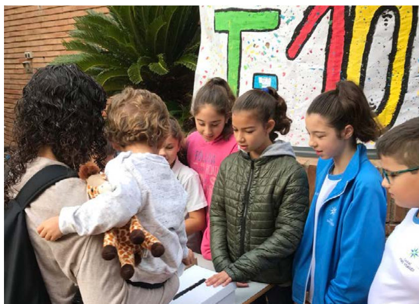
Campaña de recogida de tarjetas de transporte organizada por la escuela Garbí Pere Vergès.

¡Organizar una campaña de recogida de tarjetas de transporte T-FAMILIAR o T-CASUAL y juntos llegaremos a todos sitios!