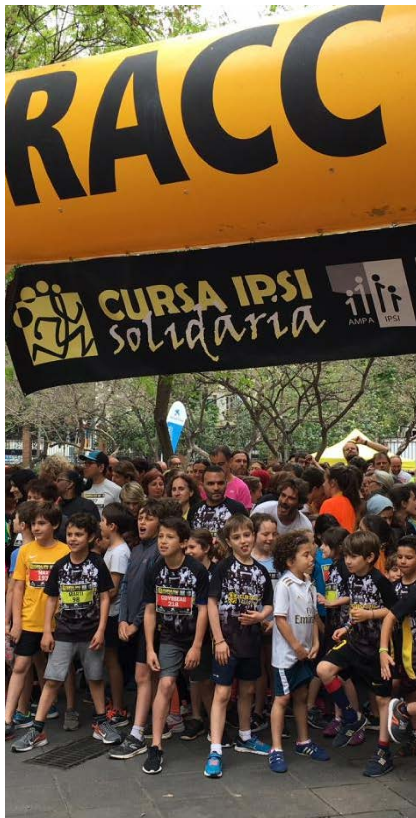
Carrera Solidaria organizada por la Escuela Ipsi.

y orígenes muy diversos y les ofrecemos actividades de ocio y aprendizaje donde trabajamos los hábitos, la convivencia, las aptitudes comunicativas y tantas otras cosas, además de garantizarles dos comidas completas y saludables al día.